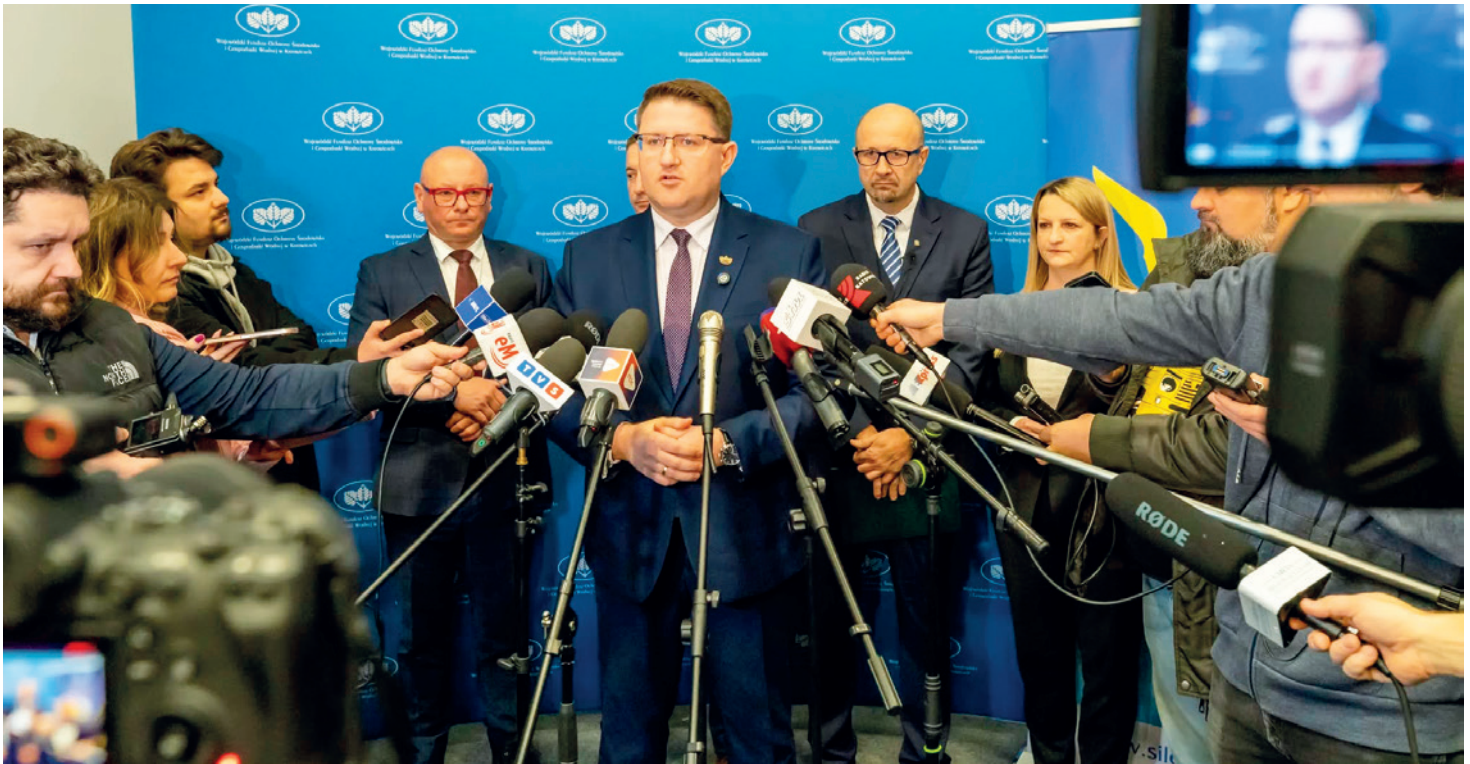
Konferencja prasowa z Mateuszem Pindlem - prezesem zarządu WFOŚiGW w Katowicach