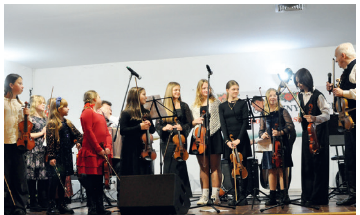
Sekcja instrumentów smyczkowych