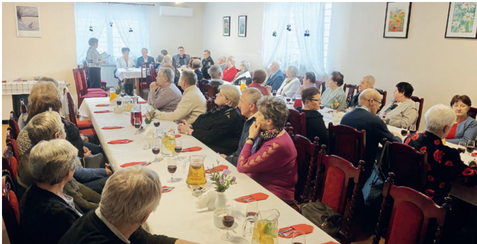
Janowiccy seniorzy przy wspólnym stole