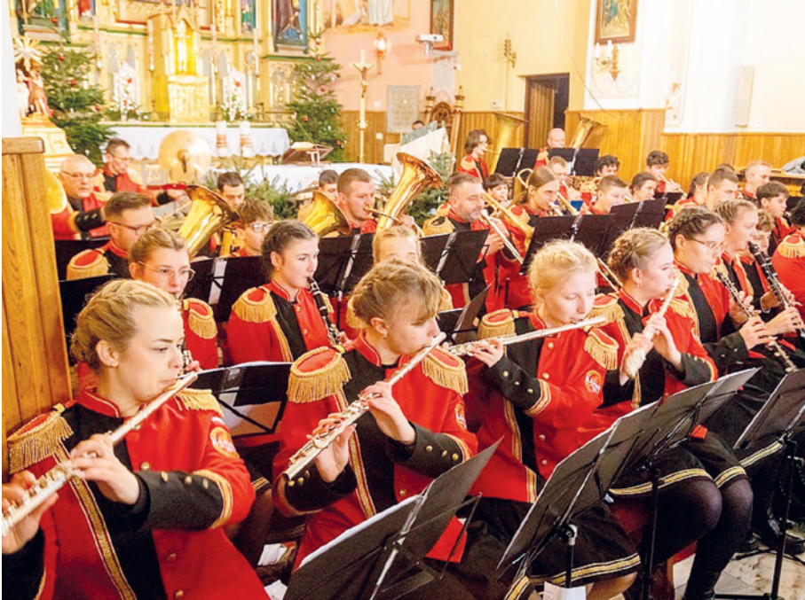
Koncert w kościele Niepokalanego Serca NMP w Kaniowie

Orkiestra Dęta Gminy Bestwina po raz kolejny udowodniła swój rodzinny charakter – w jej szeregach występują małżeństwa, rodzinstwo oraz rodzice wraz z dziećmi, co nadaje zespołowi wyjątkową, ciepłą atmosferę. Publiczność żywiołowo reagowała na każdy zaprezentowany utwór, nagradzając wykonawców gromkimi brawami. Na zakończenie zabrzmiał utwór „Znak pokoju”, a finałowym akcentem koncertu był pełen energii „Marsz Radetzky’ego” Johanna Straussa, który spotkał się z entuzjastycznym przyjęciem słuchaczy i stał się radosnym zwieńczeniem świąteczno-noworocznego spotkania z muzyką.