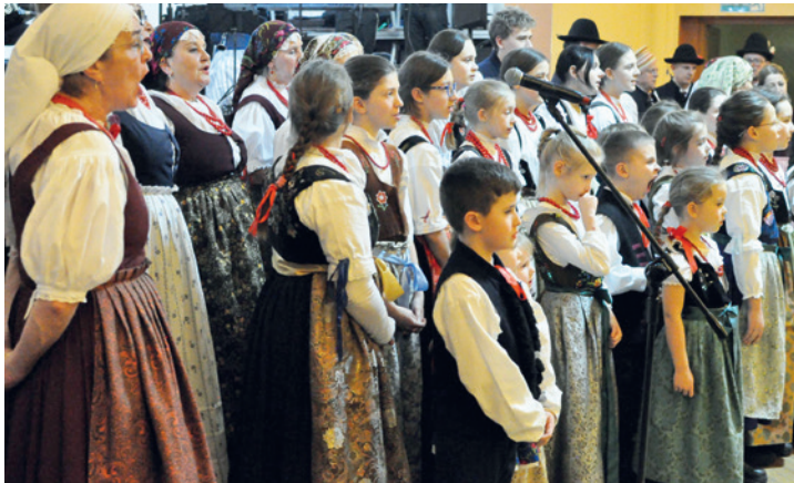
Dzieci Zespół Regionalny „Mała Bestwina” i RZPiT „Bestwina”

Gdzie tradycja spotyka dobro... tam muzykują cztery pokolenia