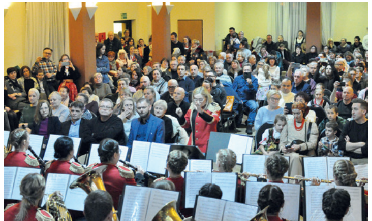
Publiczność wypełniła salę do ostatniego miejsca