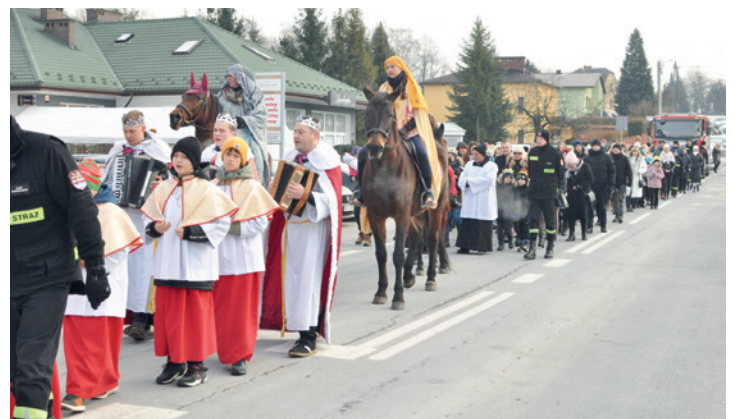
Orszak Trzech Króli na ulicach sołectwa Janowice