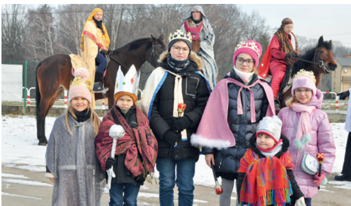
Dzieci w towarzystwie Trzech Króli na koniach

Na zdjęciach: Orszak Trzech Króli w parafii św. Józefa Robotnika w Janowicach