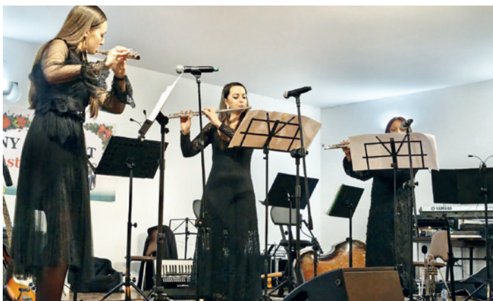
Zespół fletów poprzecznych

Program artystyczny to podróż przez style i epoki. Dominowały koledy i utwory bożonarodzeniowe, obok znanego „Jingle Bells” usłyszeliśmy „Feliz Navidad” José Feliciano, były utwory Mozarta, Czajkowskiego, Vivaldiego, Preisnera i wielu innych. Muzykę klasyczną wykonali zwłaszcza członkowie sekcji instrumentów smyczkowych i sekcji fletów poprzecznych ćwiczących przy Gminnym Ośrodku Kultury pod kierunkiem doświadczonych in-