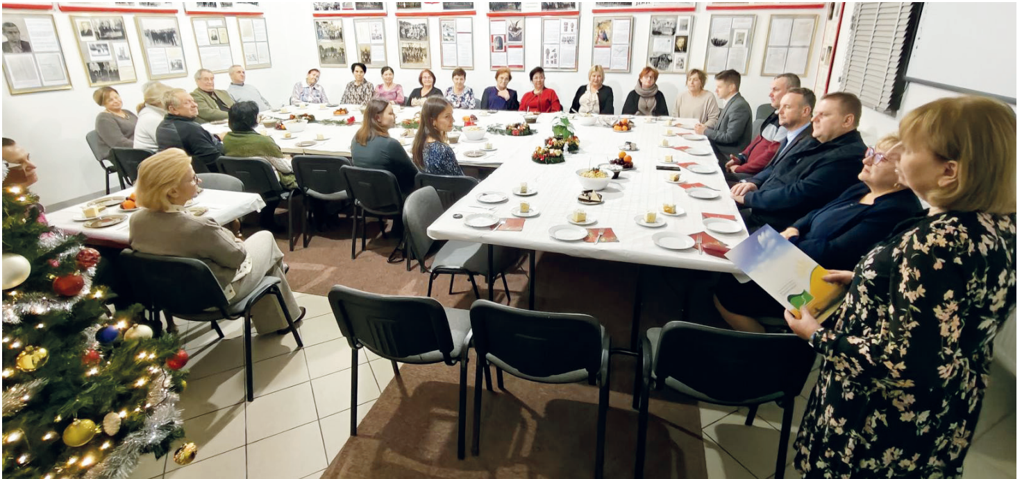
Spotkanie w odnowionej galerii Muzeum Regionalnego

Przy stole nie zabrakło akcentu regionalnego, jakim stało się przypomnienie tradycyjnych, bestwińskich zwyczajów związanych z obchodem adwentu i świąt Bożego Narodzenia. Opis z monografii ks. Z. Bubaka